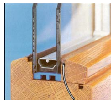
Připevnění zasklívací lišty

Obsah balení : hřebíkovačka, zástrčné klíče 2,5; 3; 4 a 5 mm, návod k obsluze S výhradou technických změn