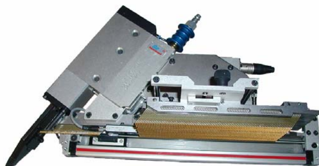
rovný zásobník pro hřebíky SKDA