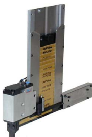
svislý zásobník – levý