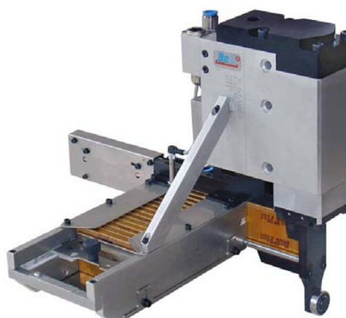
postranní zásobník – pravý