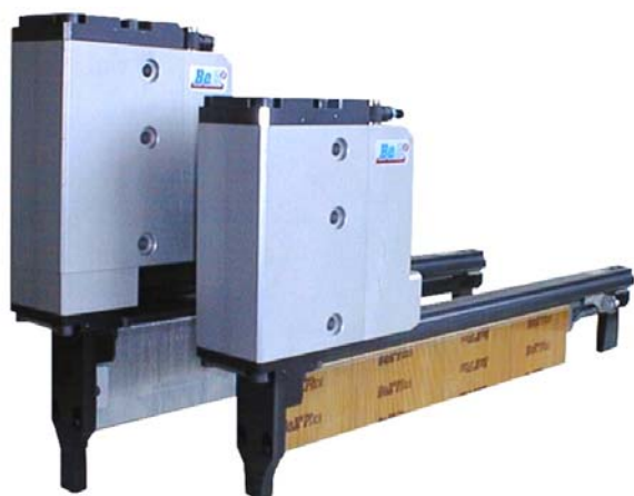
rovný prodloužený zásobník