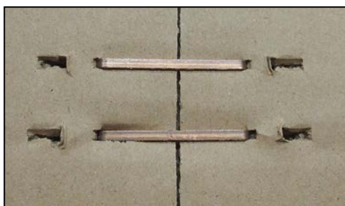
hotový spoj na víku krabice

nastavení tvaru a sevření spony, podle tloušťky kartonáže