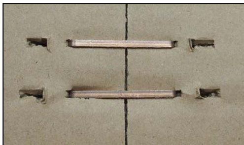
hotový spoj na víku krabice

nastavení tvaru a sevření spony, podle tloušťky kartonáže